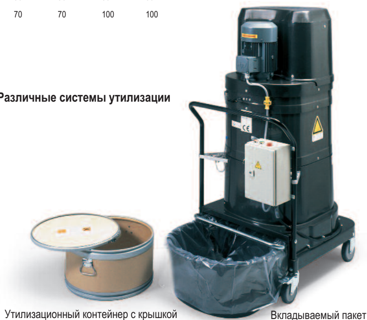
Утилизационный контейнер с крышкой