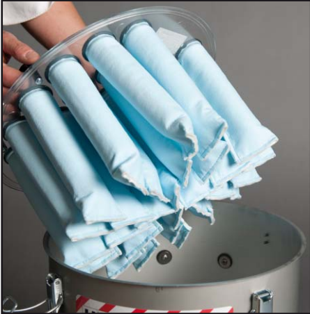
Главный фильтр (канальный фильтр)

Устройство предназначено для выполнения любых операций, сопряженных с образованием мелкодисперсной или опасной для здоровья, канцерогенной пыли, такой как цементная или шлифовальная пыль.