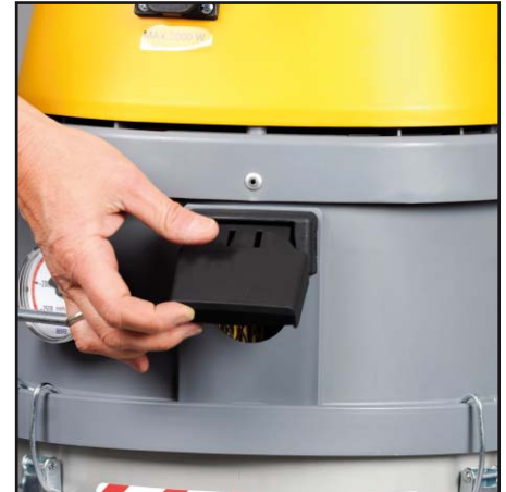
Система очистки Air-Shock