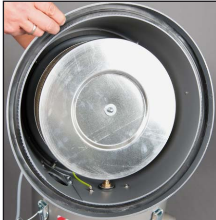
Фильтр остаточной пыли класса пылеочистки H