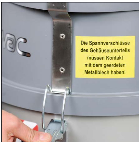
Надежность благодаря защелкам

Die Spannverschlüsse des Gehäuseunterteils müssen Kontakt mit dem geerdeten Metallblech haben!